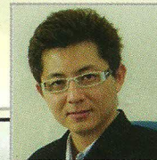
本地著名个人理财作家 罗健强